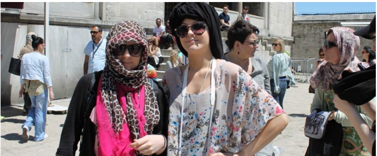
12. luokka kulttuurimatkalla Istanbulissa keväällä 2014

Ylioppilastutkinto toimeenpannaan ja suoritetaan Ylioppilastutkintolautakunnan antamien määräysten ja ohjeiden mukaisesti. Tutkinnon suorittaminen on mahdollista hajauttaa kolmelle peräkkäiselle tutkintokerralle, joten kirjoituksiin voi osallistua jossakin oppiaineessa jo 11. luokan keväällä. Tutkintoon ilmoittautumisesta ja tutkinnon suorittamisesta oppilaita informoidaan hyvissä ajoin. Ylioppilaskirjoitukseen osallistuminen edellyttää, että kyseisen aineen pakollinen oppimäärä on suoritettu hyväksytysti.