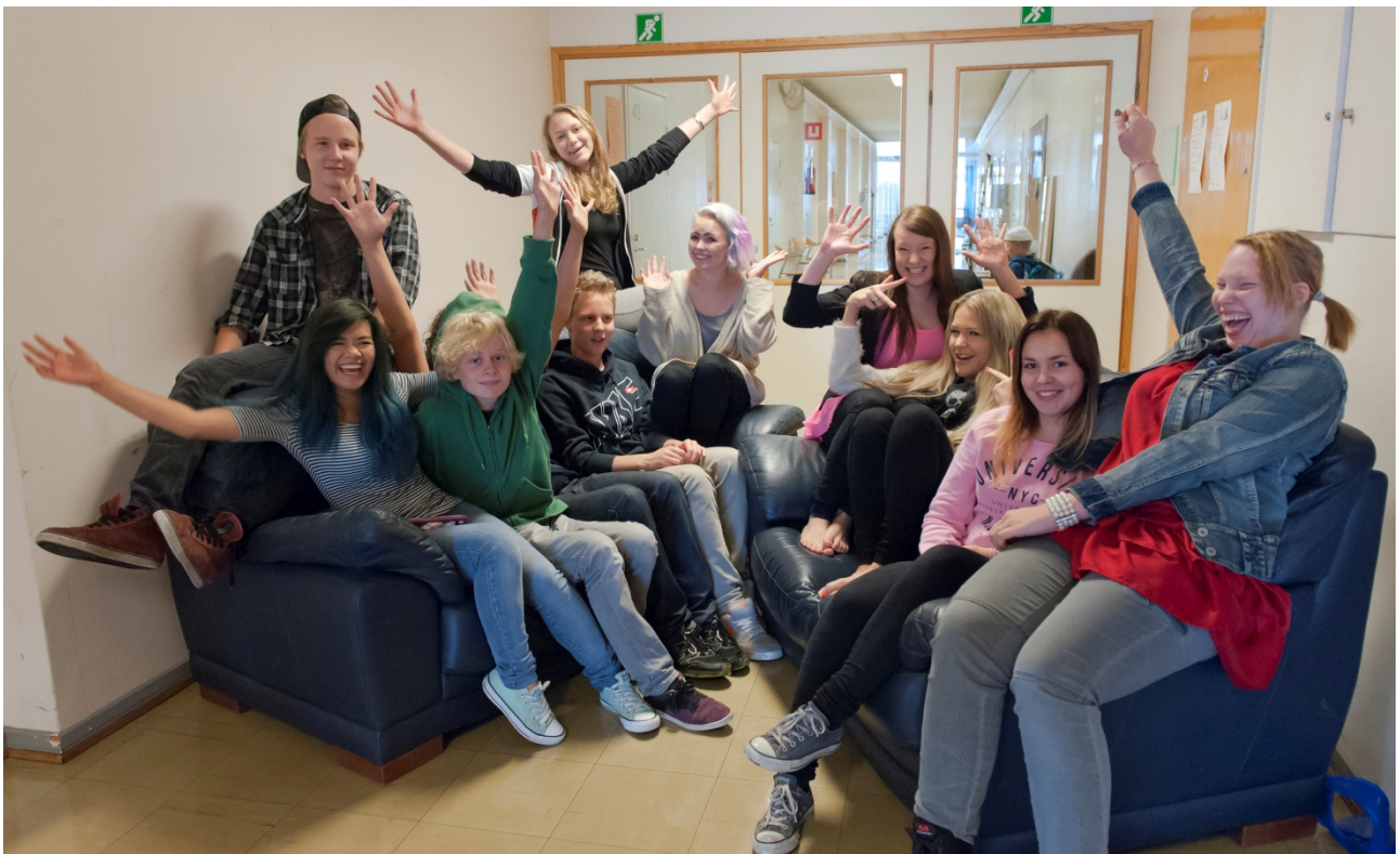
Lukion opiskelijoita koulun käytävällä syksyllä 2014

Steiner-koulu on toiminut Turussa vuodesta 1983 lähtien, lukioasteen koulutus alkoi syksyllä 1997. Koulu on 12-vuotinen yhtenäiskoulu, jonka luokat 10–12 muodostavat lukioasteen. Opetusmenetelmät perustuvat Rudolf Steinerin kehittämään ihmiskäsitykseen, jossa pyritään huomioimaan tasapainoisesti paitsi ihmisen tiedollinen myös taiteellinen, toiminnallinen, moraalinen ja sosiaalinen puoli. Tämä yleissivistävä tavoite tuo opetukseen eroja verrattuna muihin koulumuotoihin. Steiner-koulun lukioasteella täyttyvät kuitenkin myös valtakunnalliset lukion oppimäärälle asetetut tavoitteet ja sisällöt. Steiner-koulun lukion päättötodistus tuo opiskelijalle samat edut ja oikeudet kuin minkä tahansa lukion suorittaminen.