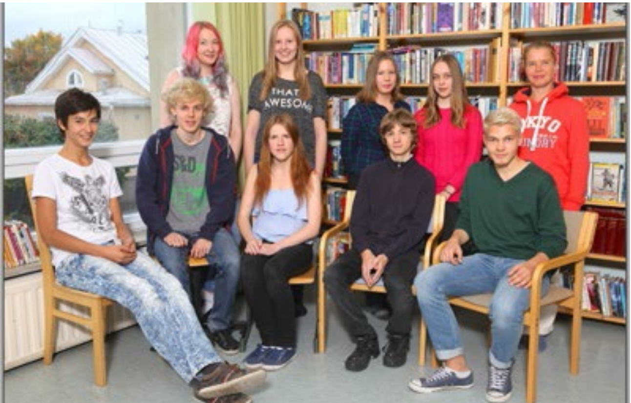
Oppilaskunnan hallitus syksy 2014

Opiskelija, joka on oppilaitoksen päätösvaltaa käyttävän elimen jäsen (esim. oppilaskunnan hallitus), on salassapitovelvollinen. Salassapitovelvollisuus koskee hänen mainitussa asemassaan saamia tietoja muiden opiskelijoiden tai henkilöstön taikka heidän perheenjäsentensä henkilökohtaisista oloista ja taloudellisesta asemasta.